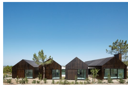
Alçado de Tardoz

No alçado principal surge também uma piscina infinita nas 4 direcções.