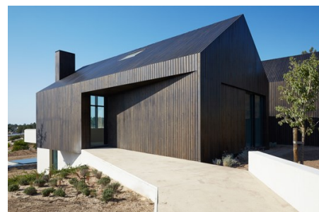
Zona de Entrada